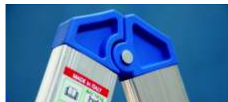
cremallera reforzada en nylon