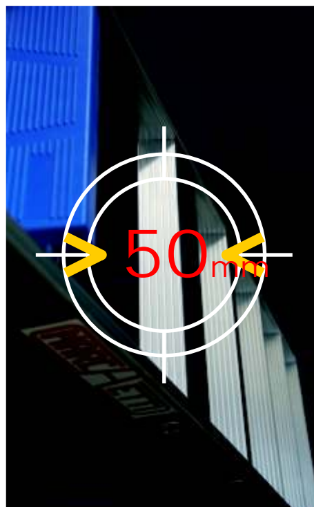
Peldaño confort de 50 mm en ambos lados,