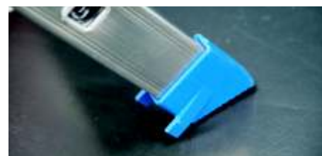
Taco en pvc