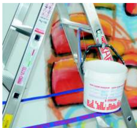
Opcional: 20690 Gancho