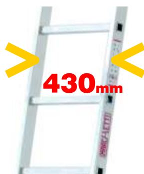
larghezza scala width ladder