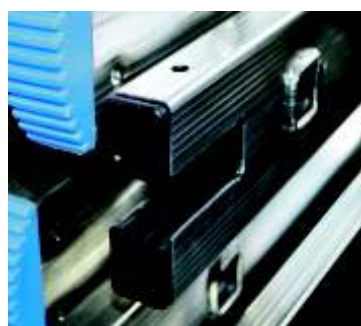
Agevolatore inserimento base stabilizzatrice Facilitator for insert stabilizer base