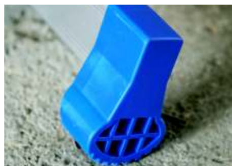
Base stabilizzatrice con tacchi antiscivolo The stabilizer base has anti-slip feet.