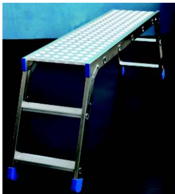
Piattaforma in lamiera mandrolata di alluminio. Grooved aluminium platform