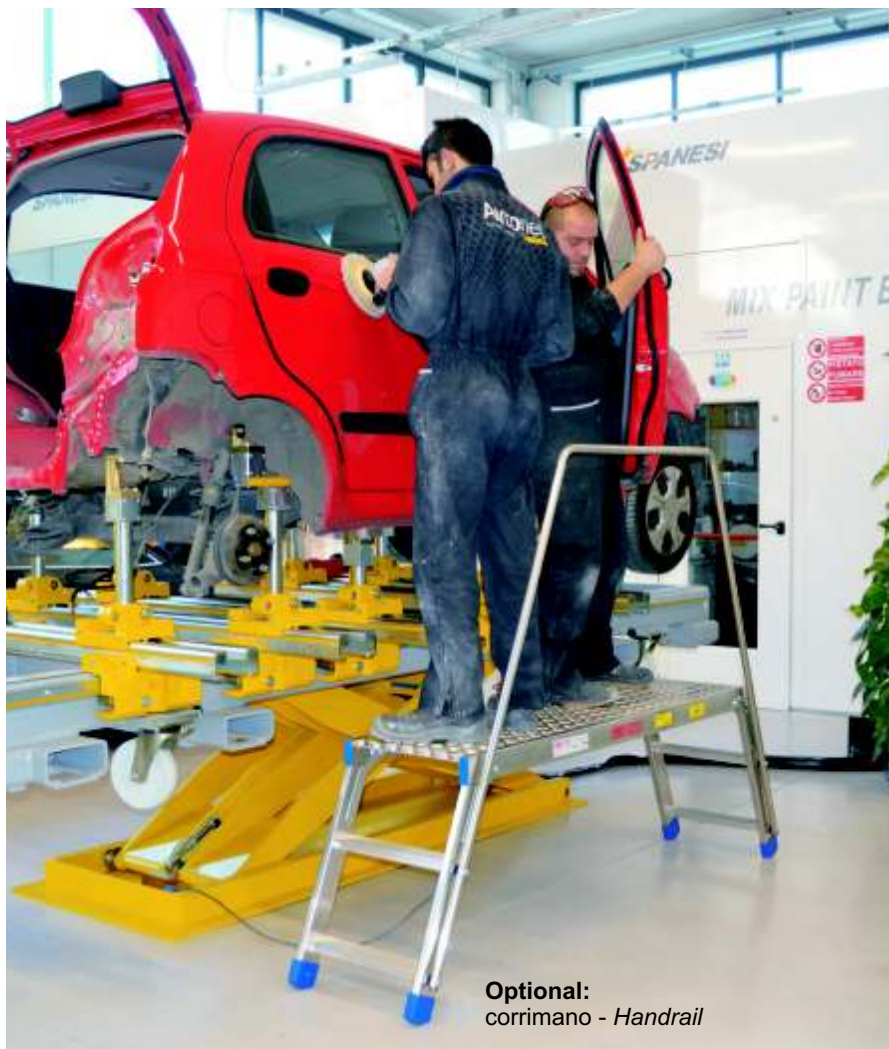
Optional: corrimano - Handrail