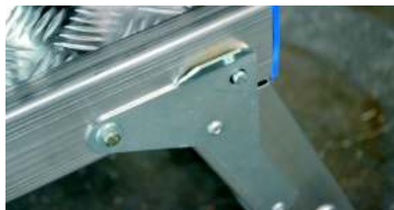
Particolare cerniera - Hinge detail

STEP is completely in aluminum , including the antislip platform , this allows it to be used in many areas of work, can also be used where there oil or liquid substances (workshop, garage, car repair, chemical industry,...). 250 kg load permitted and mm 425 platform width , that allow two operators to work simultaneously. Is foldable . Packaging in shrink wrap.